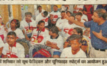
आल्मा मातेर में शनिवार को युव फेस्टिवल और यूनियनइड स्पोर्ट्स का आयोजन हुआ

स्पेशल ओलंपिक ने शनिवार को युव फेस्टिवल और यूनियनइड स्पोर्ट्स का आल्मा मातेर स्कूल में आयोजन किया। इसमें सामान्य और स्पेशल बच्चों ने एक साथ ड्राइंग, डांस, सिंगिंग, यूनियनइड स्पोर्ट्स पोस्टर, डिबेट, ग्रुप डिस्कशन, फन गेम्स, यूनियनइड बास्केटबॉल में भाग लिया। आशा स्पेशल स्कूल की स्पेशल छात्रा ने घुमर डांस, जीवनधारा