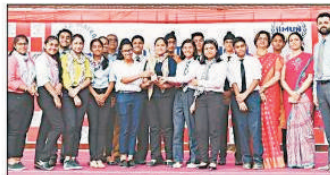
कार्यक्रम में विद्यार्थियों को सम्मानित किया गया। अमर उज्ज्वल