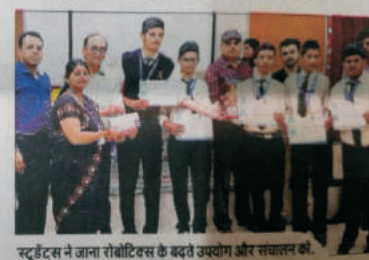
स्टूडेंट्स ने जाना रोबोटिक्स के बढ़ते उपयोग और संचालन को.