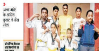
आल्मा मातेर के छात्रों ने आगरा में जीते 16 मेडल